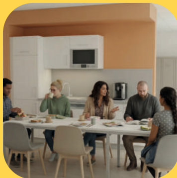
Küchen für die Kitaversorgung