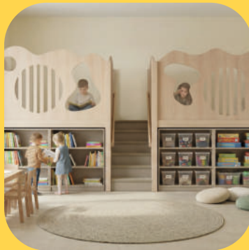
Hochebenen und Podeste