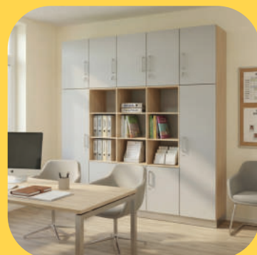
Bürolösungen für Leitungen und Sozialräume