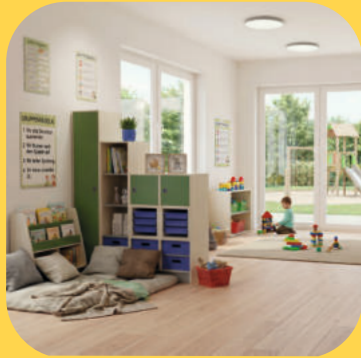
Gruppenräume und Aufbewahrung