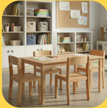
Stühle und Tische