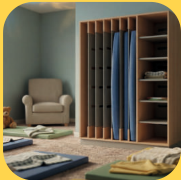
Ruheräume und Schlafen